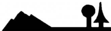
Ontluikende

Fornheselaan 202 - 216 3734 GE Den Dolder Tel. Bedrijf: 030-2290600 Tel. Privé: 030-6563377 Geopend: ma t/m vr. 7.30 - 12.00 uur en 13.00 - 16.30 uur, za. Gesloten